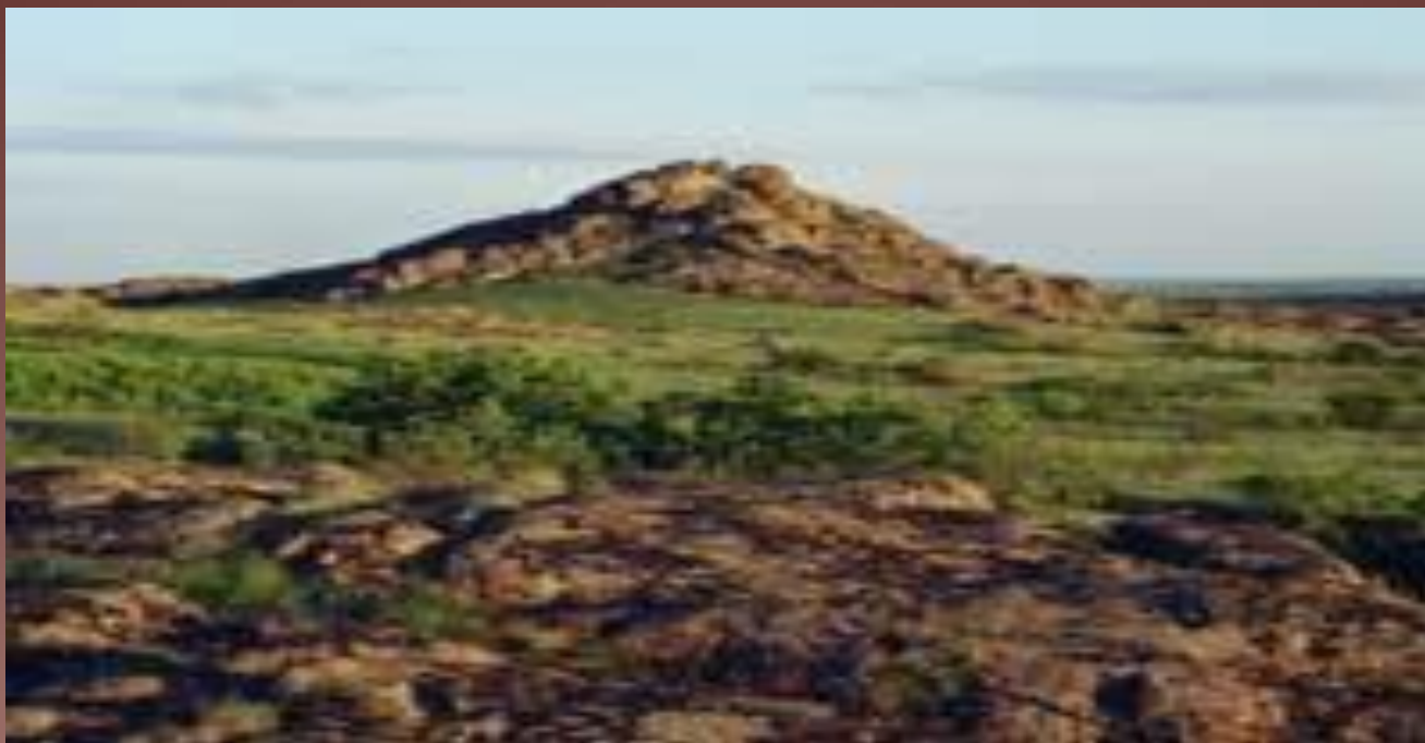
Кам'яна могила – пам'ятка природи в степу.

У східній частині абсолютні висоти території сягають найбільших показників – 367 м (гора Могила Мечетна). Кургани-могили є виходами на поверхню кристалічних порід Українського щита та Донецької складчастої споруди.